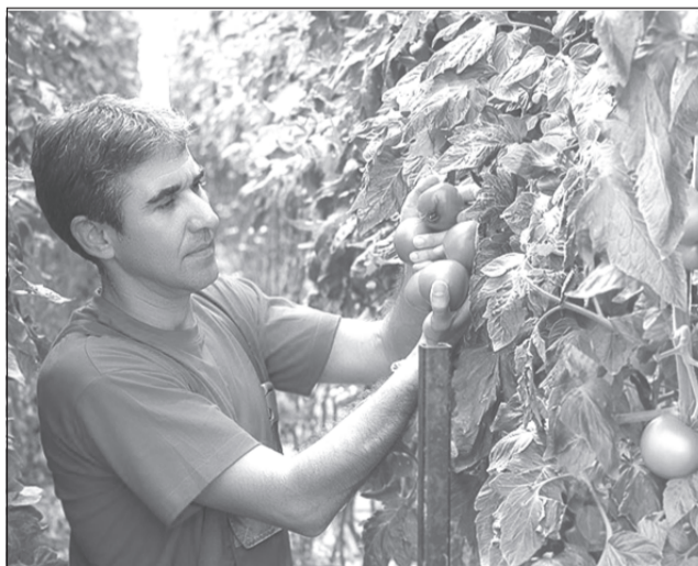
Биоветерий — та же теплица, но вместо обычного грунта используется биогумус, выработанный специальными червями. Почва же обогревается подземными трубами

Технология утилизации различных органических отходов с помощью промышленной линии дождевых (компостных) червей «Старатель» получена в 1982 году путем скрещивания двух популяций российской и киргизской навозных червей. В закрытых помещениях разведение «Старателя» осуществляется круглогодично. Они предназначены для ускоренной и более качественной переработки органических отходов сельского хозяйства и промышленности (навоза, птичьего помета, растительных остатков, отходов пищевой промышленности) в биогумус. Это высокоэффективное удобрение, применение которого улучшает агрохимические свойства, повышает качество и увеличивает урожай сельскохозяйственной продукции.