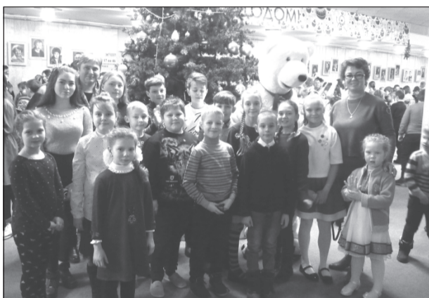
Приволжская ребятня веселится у ёлки

Мальчишки и девчонки Приволжского района вновь побывали на новогоднем представлении в г.Иваново.