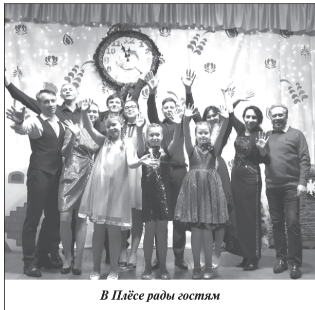
В Плесе рады гостям

Зал не скупился на аплодисменты, глаза ребят сияли восторгом. Но горячий прием зрителей стал не единственной наградой – сойдя со сцены, детвора попала за сладкий стол.