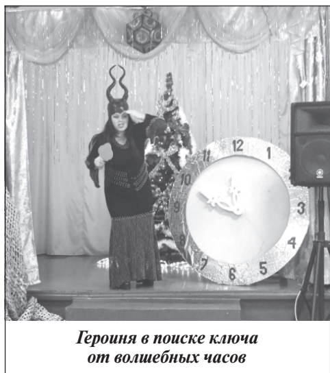
Героиня в поиске ключа от волшебных часов

Артисты ГДК отправились на новогодние гастроли по приволжской земле. В гостеприимном селе Рождествено они дали спектакль «Мышиный король или путешествие в никуда».