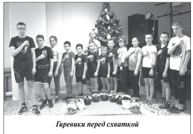
Гиревики перед схваткой