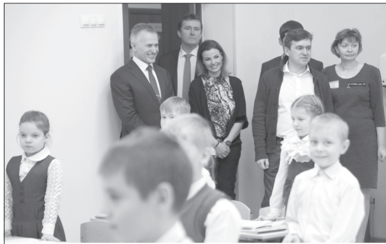
Губернатор области Станислав Воскресенский осматривает новую школу в пос. Савино.

На строительство школы и её оснащение из федерального бюджета и бюджета Ивановской области в 2017-2019 годах выделено 590,95 млн рублей (502,6 млн рублей и 88,35 млн рублей соответственно).