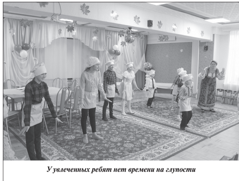
У увлеченных ребят нет времени на глупости

Активное участие в проведении операции «Лидер» приняли сотрудники ЦСО, отделения профилактической работы с семьёй и детьми. Они не только участвовали в обследовании мест концентрации несовершеннолетних и условий проживания семей, находящихся в социально опасном положении, но и осуществили выходы в школы, провели встречи с учащимися. Также на их счету ряд благотворительных акций, мастер-классы, конкурсы рисунков, большое совместное новогоднее мероприятие с Центром развития ребёнка «Русалочка» из г. Волгореченска.