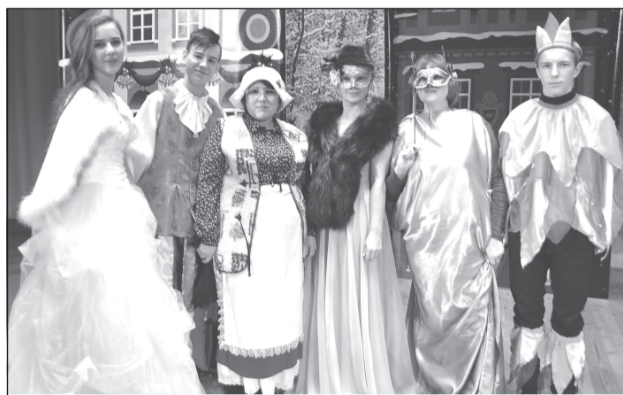
Главные герои спектакля

В Городском доме культуры состоялась премьера спектакля «Девочка со спичками». Постановка стала совместным творчеством театральных коллективов «Жар-птица» и «Миниатюра», сотрудников учреждения, вокального ансамбля «Веселинка» и детского образцового хореографического коллектива «Колибри».